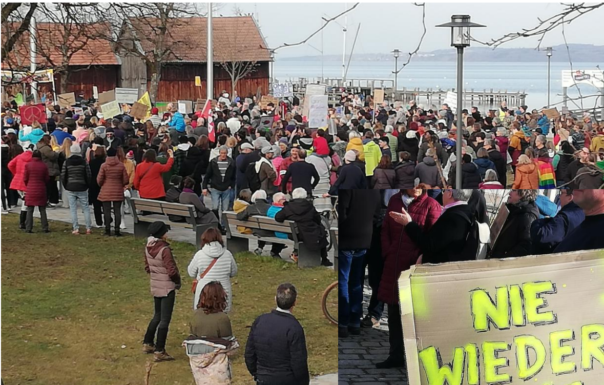
Demo am Samstag, 22. Februar 2025, in Diessen „Ammersee taucht auf gegen Rechts“